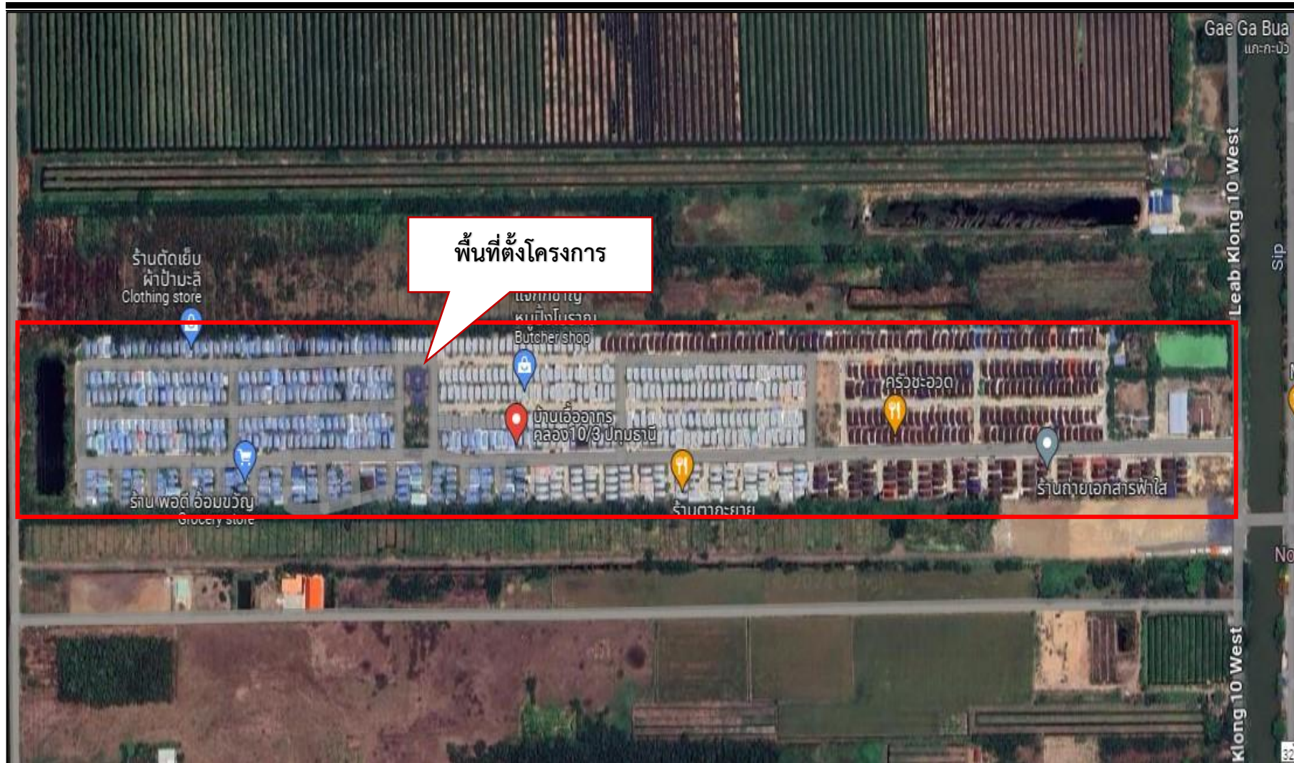
รูปที่ 1.2-1 ที่ตั้งของโครงการ